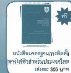
หนังสือมาตรฐานการติดตั้งทางไฟฟ้าสำหรับประเทศไทยเล่มละ 360 บาท